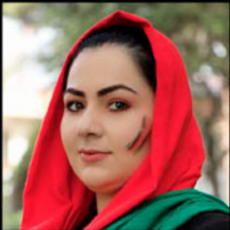
Khadija Amin Periodista y activista en Afganistán, denuncia la

Desde 2018 miembro activo de la defensa con Afghan Women Network (AWN) para la participación de las mujeres a nivel nacional e internacional sobre el proceso de paz.