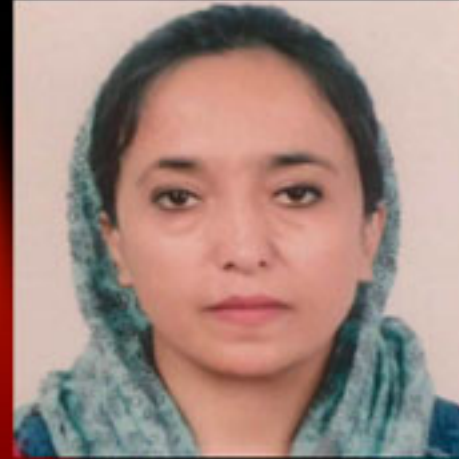
Massouda Kohistani Activista social y política, defensora de los derechos de la mujer en